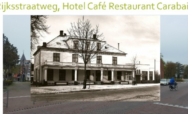
Rijksstraatweg, Hotel Café Restaurant Carabain

Op 23 januari 2024 geeft Nelis van Ooijen een lezing over de winkels in Geldermalsen in de jaren '50. Deze lezing wordt door onze vereniging in samenwerking met 'Het Nut' georganiseerd en is een vervolg op de lezing die hij in jan. '23 heeft verzorgd.