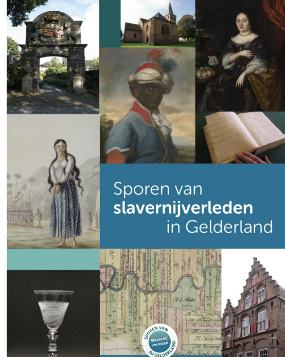
Sporen van slavernijverleden in Gelderland

Onderzoek naar de slavernijverleden - en doorwerking van dit verleden - staat de laatste jaren prominent op landelijke én regionale onderzoeksagenda's. Het koloniale slavernijverleden is een belangrijk onderdeel van de Nederlandse geschiedenis. De Nederlandse Staat (Staat & Slavernij), verschillende steden en provincies hebben onderzoek gedaan naar deze geschiedenis, of zijn vergelijkbare bezigheden. Ook in Gelderland zijn sporen van slavernijverleden te vinden. Er zijn politiek-financiële systemische sporen van Gelderlanders die betrokken zijn bij koloniaal en slavernijbeleid namens staat, provincie, regio en/of stad, en persoonlijk als (slaven)handelaar, plantagebezitter of investeerder. Er zijn materiële sporen in huizen, landgoederen en collectiestukken in archieven en musea. Er zijn immateriële sporen, persoonlijke verhalen van mensen die betrokken waren bij het slavernijverleden, van slaveneigenaren en slaafgemaakten, maar zeker ook van nazaten. Vanuit het bredere Nederlandse/Gelderse verhaal wordt begonnen (het verleden - én heden - vinden niet plaats in een vacuüm) om vervolgens te kijken naar regionale sporen en kansen/mogelijkheden voor verder (lokaal) onderzoek.