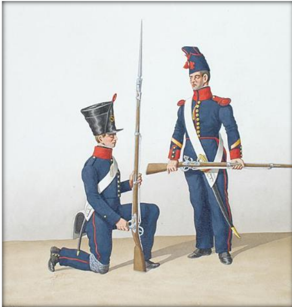
Fuselier 1830 (links)

Een verslag over 2 gewone soldaten uit Zeeland en Gelderland met de naam van Gessel.