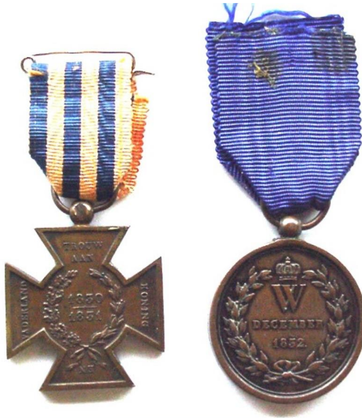
Citadel Medaille (Rechts tekstzijde) (Links, tekstzijde Metalen Kruis)